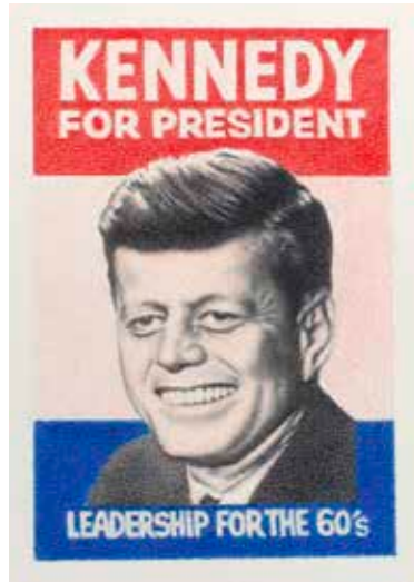
Leadership , 2014 Grafito y lápiz color sobre papel 12 x 8 cm