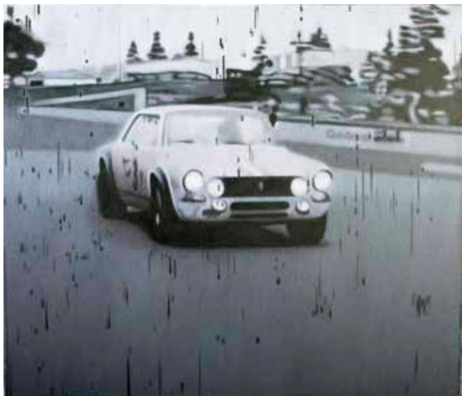
El número 3 - Secuencia N° 2 , 2016