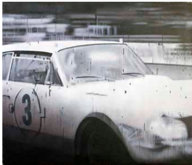
El número 3 - Secuencia N° 4 , 2016