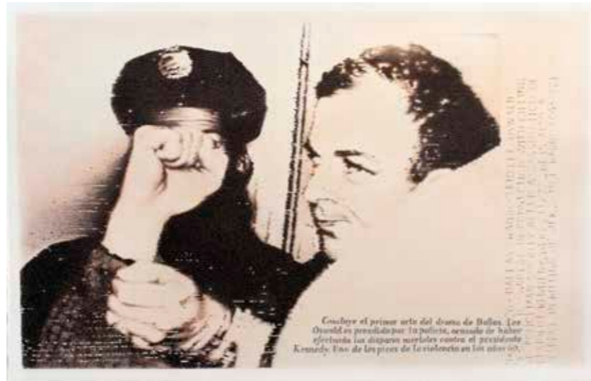
Dallas , 2013 Grafito y lápiz color sobre papel 36 x 56 cm