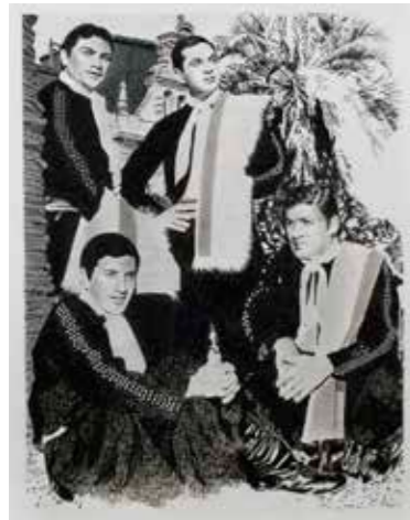
Los 4 de Córdoba , 2016 Carbón, grafito y lápiz color sobre papel 38 x 29 cm