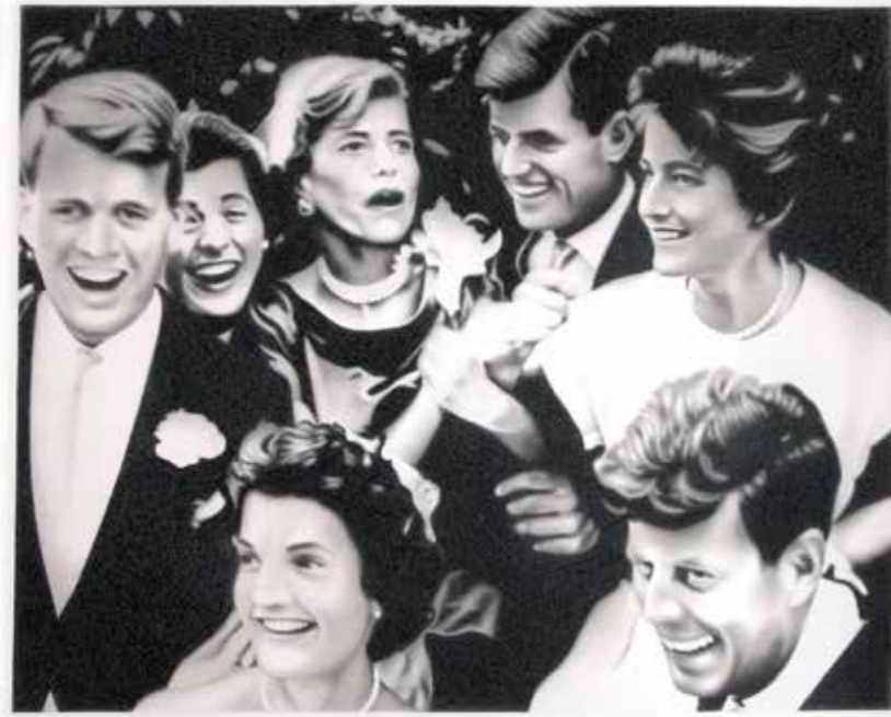
Fiesta , 2013 Carbón y grafito sobre papel 43 x 53 cm